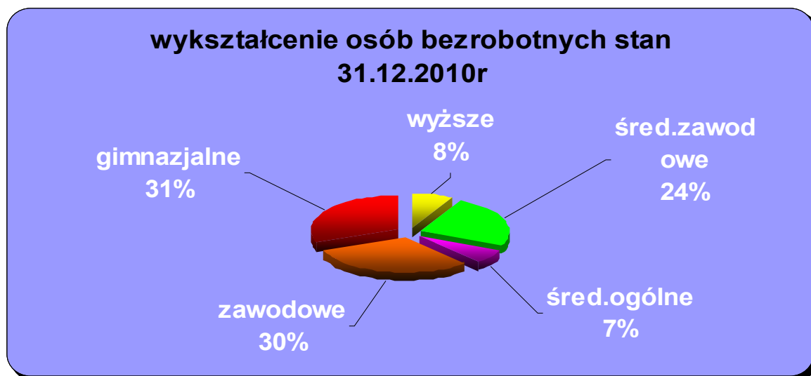
Diagram nr 1

Następny diagram przedstawia informacje o wykształceniu osób bezrobotnych obrazując trudną sytuację osób bez zawodu. Ze statystyk wynika, że są to osoby z wykształceniem gimnazjalnym i niższym (1887), w większości dotychczas niepracujący lub pracujący mniej niż 12 m-cy.